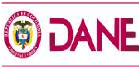
Ilustración 4 logo DANE

Actualmente en el proyecto de Colombia científica ya se están realizando los respectivos acuerdos con el DANE para tener el acceso a la base de datos de ellos y así fortalecer los análisis del proyecto.