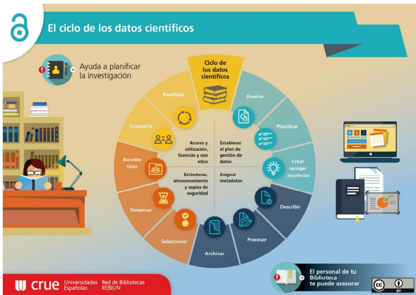
Ilustración 1 Ciclo de vida de los datos científicos.