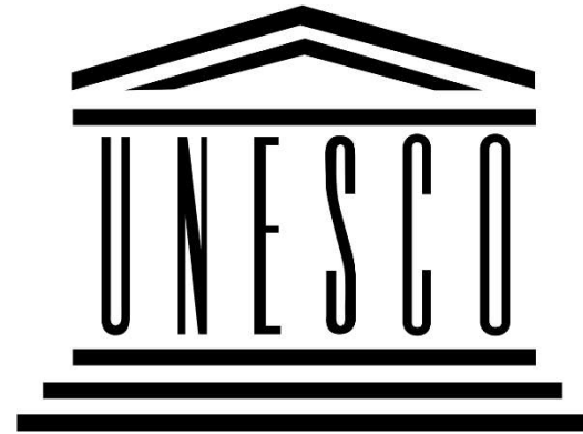
Ilustración 7 Logo UNESCO

La UNESCO trata de buscar la llamada “paz” ayudando al desarrollo de la educación la ciencia y la cultura, además de tener enfoques en el desarrollo de la sostenibilidad , partiendo del hecho de que gran parte de la informalidad nace de personas que no tuvieron los recursos para formarse educativamente o simplemente por un motivo de fuerza mayor no pudo lograrlo , la página de la UNESCO https://es.unesco.org/ hay un apartado donde podemos acceder a estadísticas y publicaciones sobre estudios realizados por la entidad, estos archivos pueden servir como fuente de información para el contexto que maneja Colombia científica en su objetivo general.