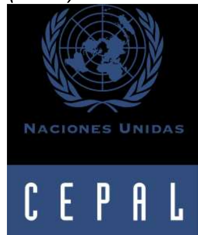
Ilustración 3 logo CEPAL